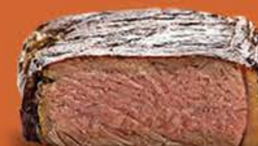
AO PONTO P/ O BEM