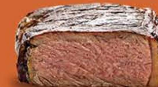
AO PONTO P/ O BEM