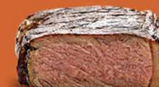
AO PONTO P/ O BEM