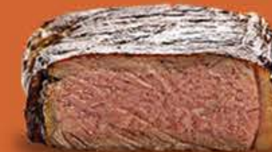
AO PONTO P/ O BEM